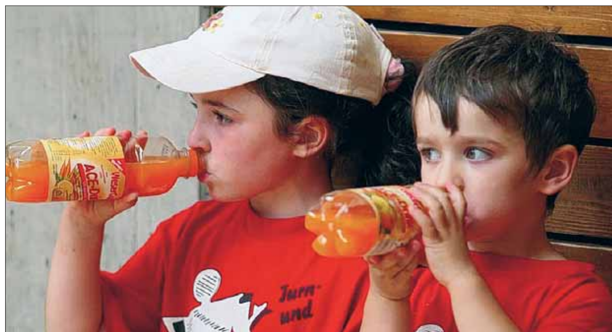
Synchron durstig: Die beiden kleinen Wettkämpfer haben sich einen Schluck aus der Flasche verdient.