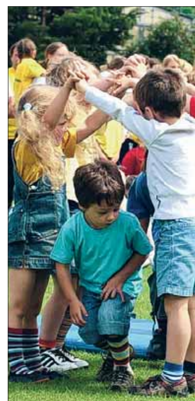
...und bei den Kindern von der veranstaltenden TG Trossingen hieß es: „Mach auf die Tür!“.