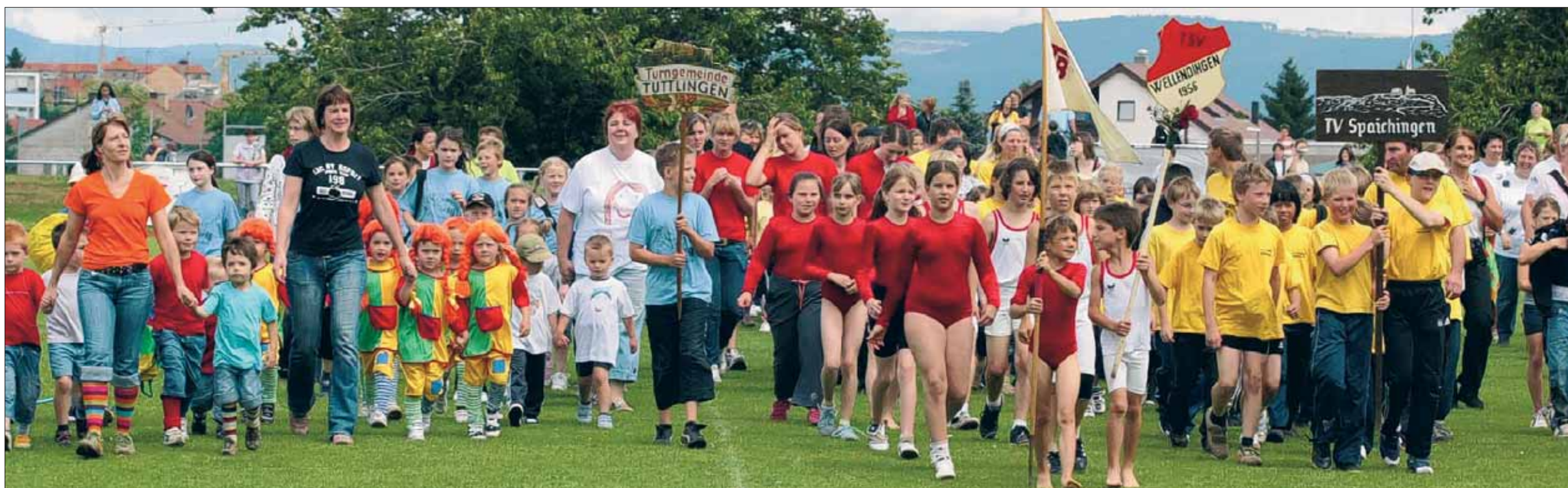
Beim Gaukinderturnfest präsentierten die rund 700 Kinder beim Einmarsch ins Trossinger Stadion ein prächtiges und farbenfrohes Bild. Gastgeber war in diesem Jahr die TG Trossingen.