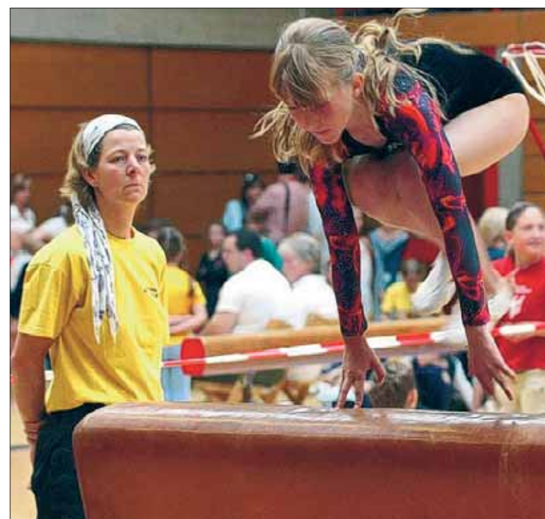
Unter den kritischen Augen der Kampfrichterinnen turnten die Mädchen aller Altersklassen in der Solweg-Sporthalle.