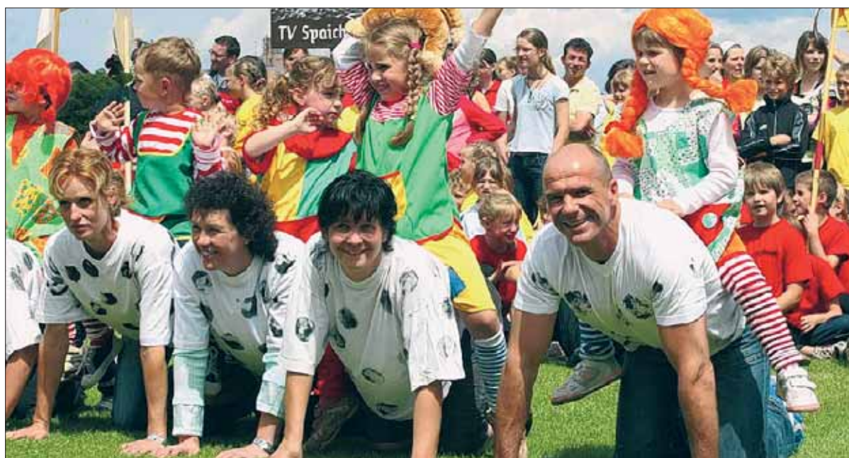
Mit Mama und Papa einmal so richtig rumtoben war für die Kinder des TV Gunningen ein Riesenspaß.