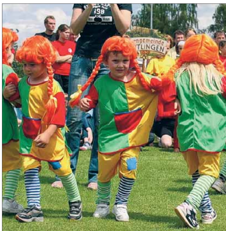
Die Vorschulkinder des TV Hausen ob Verena tanzten in Trossingen als Pippi Langstrumpf...